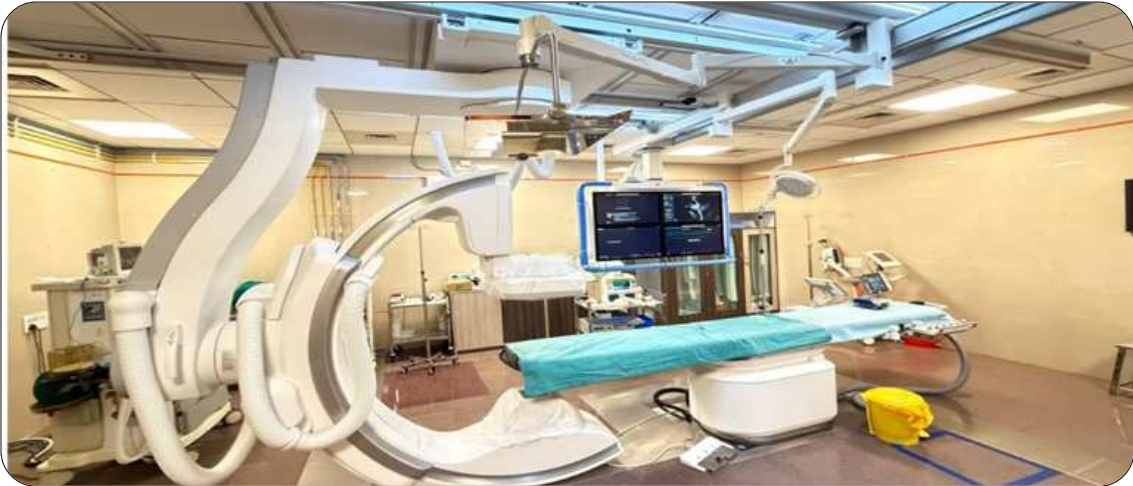
ಕ್ಯಾತ್‌ಲ್ಯಾಬ್, ಅತ್ಯಾಧುನಿಕ ಎಐ ಆಧಾರಿತ ಸಿಟಿ ಸ್ಕ್ಯಾನರ್