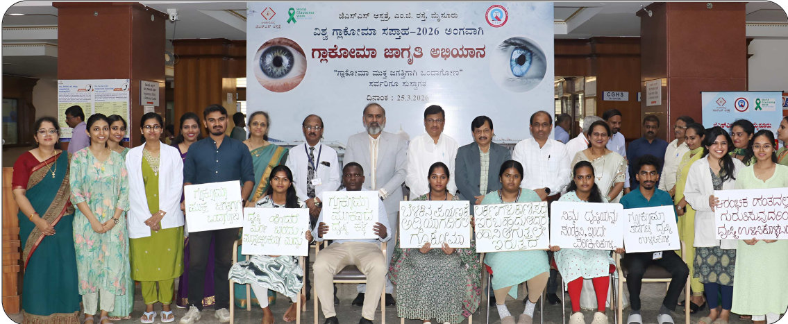
ಗ್ಲಾಕೋಮಾ ಜಾಗೃತಿಗೆ ಸಂಬಂಧಿಸಿದಂತೆ ವಿದ್ಯಾರ್ಥಿಗಳು ಭಿತ್ತಿಪತ್ರಗಳನ್ನು ಪ್ರದರ್ಶಿಸುತ್ತಿರುವುದು