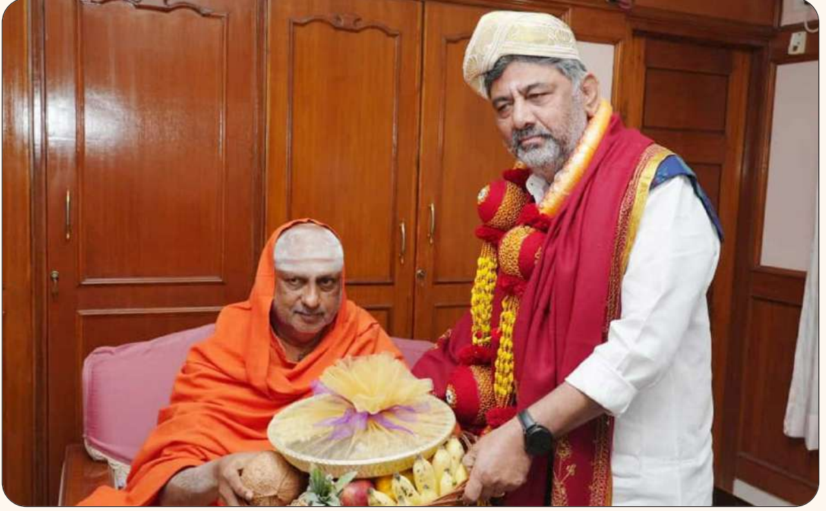
ಬೆಂಗಳೂರಿನಲ್ಲಿರುವ ಸುತ್ತೂರು ಸದನಕ್ಕೆ ಉಪಮುಖ್ಯಮಂತ್ರಿಗಳಾದ ಶ್ರೀ ಡಿ.ಕೆ. ಶಿವಕುಮಾರ್‌ರವರು ಭೇಟಿ ನೀಡಿದ ಸಂದರ್ಭದಲ್ಲಿ ಪರಮಪೂಜ್ಯ ಜಗದ್ಗುರುಗಳವರು ಸನ್ಮಾನಿಸಿ ಆಶೀರ್ವದಿಸಿದರು (24 ಫೆಬ್ರವರಿ 2026)