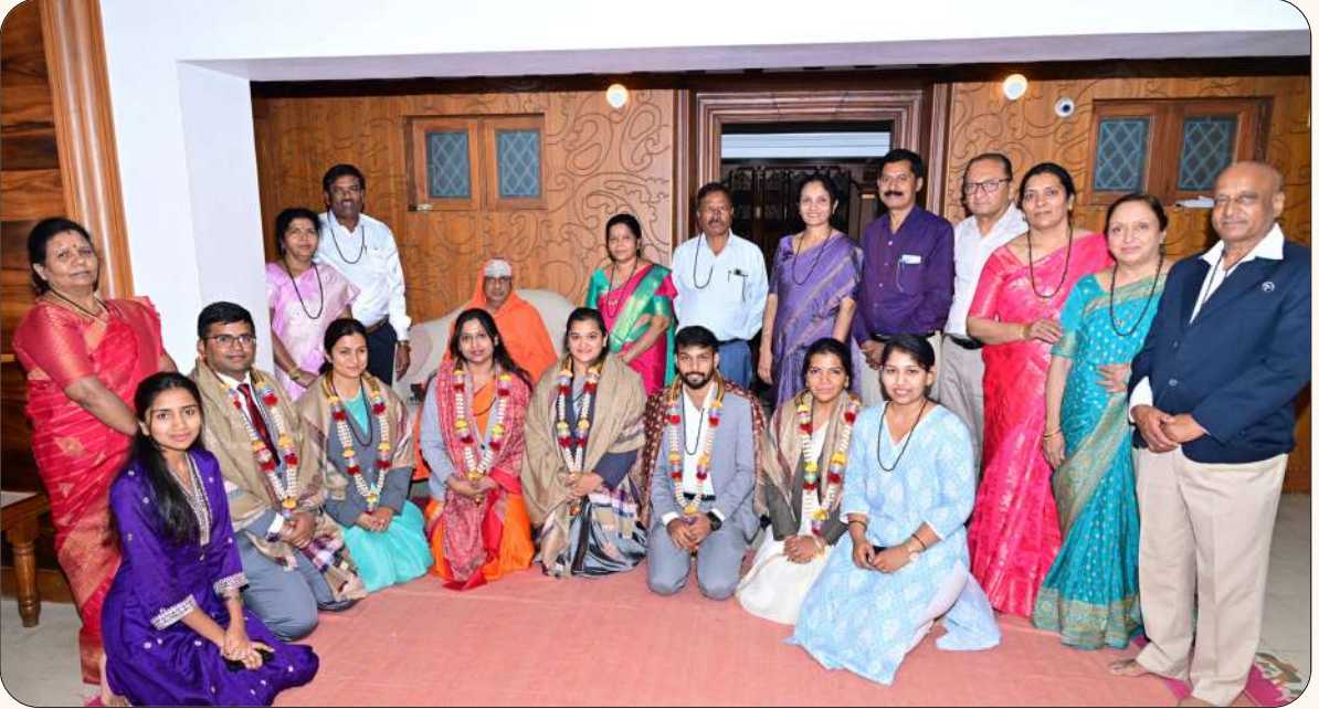
ಮೈಸೂರಿನ ಜೆಎಸ್‌ಎಸ್ ಕಾನೂನು ಕಾಲೇಜಿನ ವಿದ್ಯಾರ್ಥಿಗಳು ಸಿವಿಲ್ ನ್ಯಾಯಾಧೀಶರ ಹುದ್ದೆಗೆ ಆಯ್ಕೆಯಾದ ಸಂದರ್ಭದಲ್ಲಿ ಪರಮಪೂಜ್ಯ ಜಗದ್ಗುರುಗಳವರು ಅವರುಗಳಿಗೆ ಆಶೀರ್ವದಿಸಿದರು (5 ಮಾರ್ಚ್ 2026)