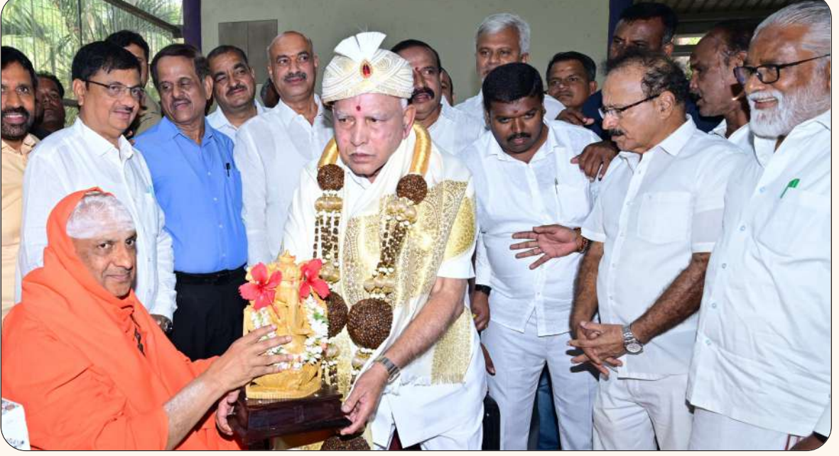
ಮೈಸೂರಿನ ಸುತ್ತೂರು ಶ್ರೀಮಠಕ್ಕೆ ಮಾಜಿ ಮುಖ್ಯಮಂತ್ರಿಗಳಾದ ಶ್ರೀ ಬಿ.ಎಸ್. ಯಡಿಯೂರಪ್ಪನವರು ಭೇಟಿ ನೀಡಿದ ಸಂದರ್ಭದಲ್ಲಿ ಪರಮಪೂಜ್ಯ ಜಗದ್ಗುರುಗಳವರು ಸನ್ಮಾನಿಸಿ ಆಶೀರ್ವದಿಸಿದರು. (6 ಮಾರ್ಚ್ 2026)