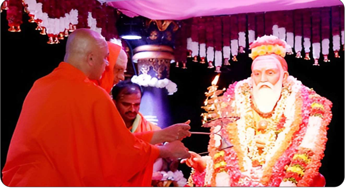
ಸುತ್ತೂರು ಶ್ರೀಕ್ಷೇತ್ರದ ಕಪಿಲಾ ನದಿಯಲ್ಲಿ ವಿಜೃಂಭಣೆಯಿಂದ ಜರುಗಿದ ಆದಿ ಜಗದ್ಗುರು ಶ್ರೀ ಶಿವರಾತ್ರೀಶ್ವರ ಶಿವಯೋಗಿಗಳವರ ತೆಪೋತ್ಸವಕ್ಕೆ ಪರಮಪೂಜ್ಯ ಜಗದ್ಗುರುಗಳವರು ಮತ್ತು ಆದಿಚುಂಚನಗಿರಿ ಜಗದ್ಗುರುಗಳವರ ದಿವ್ಯ ಸಾನ್ನಿಧ್ಯದಲ್ಲಿ ಚಾಲನೆ ನೀಡಲಾಯಿತು. (19 ಜನವರಿ 2026)