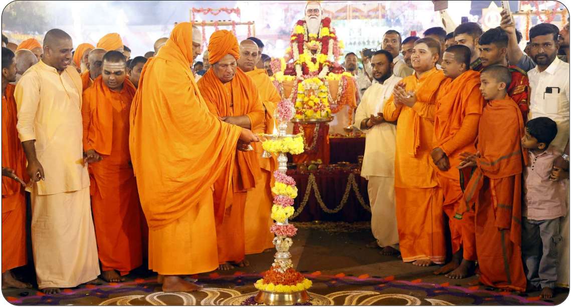
ಜಾತ್ರಾ ಮಹೋತ್ಸವದಲ್ಲಿ ಲಕ್ಷದೀಪೋತ್ಸವ ಕಾರ್ಯಕ್ರಮವನ್ನು ಪರಮಪೂಜ್ಯ ಜಗದ್ಗುರುಗಳವರ ದಿವ್ಯಸಾನ್ನಿಧ್ಯದಲ್ಲಿ ಜ್ಯೋತಿ ಬೆಳಗಿಸುವ ಮೂಲಕ ಉದ್ಘಾಟಿಸಲಾಯಿತು. (18 ಜನವರಿ 2026)