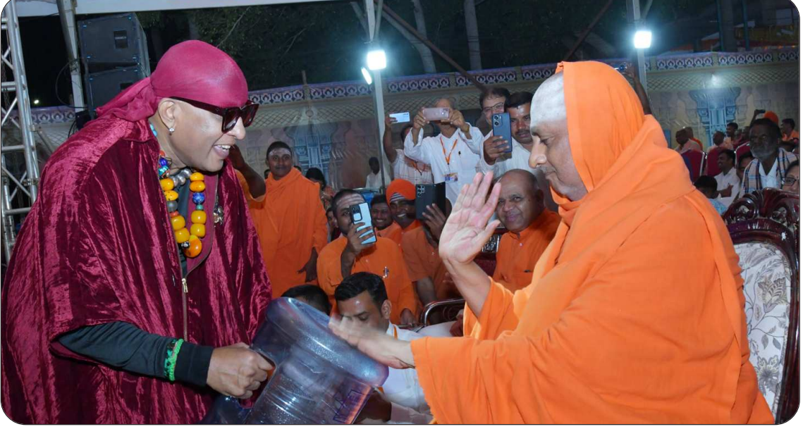
ಜಾತ್ರಾ ಮಹೋತ್ಸವದಲ್ಲಿ ಡ್ರಮ್ಸ್ ವಾದಕರಾದ ಕಲೈಮಾಮಣಿ ಶಿವಮಣಿಯವರೊಂದಿಗೆ ಡ್ರಮ್ಸ್ ವಾದನ ಕಾರ್ಯಕ್ರಮದಲ್ಲಿ ಪರಮಪೂಜ್ಯ ಜಗದ್ಗುರುಗಳವರು ನುಡಿಸುತ್ತಿರುವುದು. (16 ಜನವರಿ 2026)