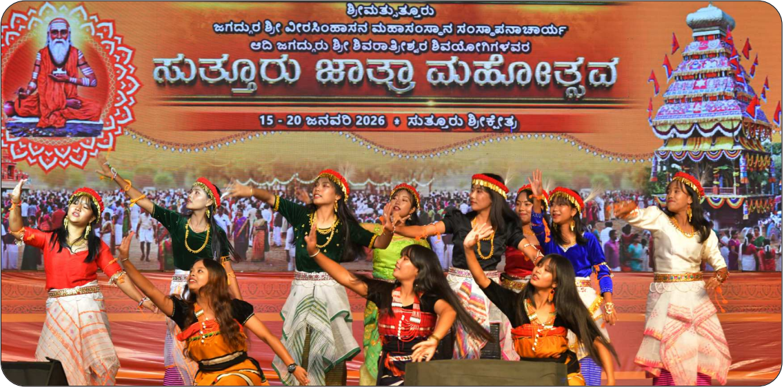
ಸುತ್ತೂರು ಜಾತ್ರಾ ಮಹೋತ್ಸವದಲ್ಲಿ ಜಿಎಸ್‌ಎಸ್ ಸಂಸ್ಥೆಯ ವಿದ್ಯಾರ್ಥಿಗಳಿಂದ ಸಾಂಸ್ಕೃತಿಕ ಕಾರ್ಯಕ್ರಮ