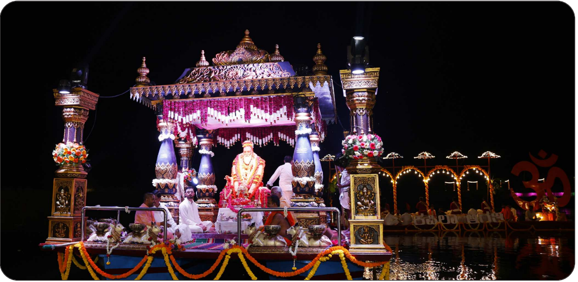
ಸುತ್ತೂರು ಶ್ರೀಕ್ಷೇತ್ರದ ಕಪಿಲಾ ನದಿಯಲ್ಲಿ ವಿಜೃಂಭಣೆಯಿಂದ ಜರುಗಿದ ಆದಿ ಜಗದ್ಗುರು ಶ್ರೀ ಶಿವರಾತ್ರೀಶ್ವರ ಶಿವಯೋಗಿಗಳವರ ತೆಪೋತ್ಸವ (19 ಜನವರಿ 2026)