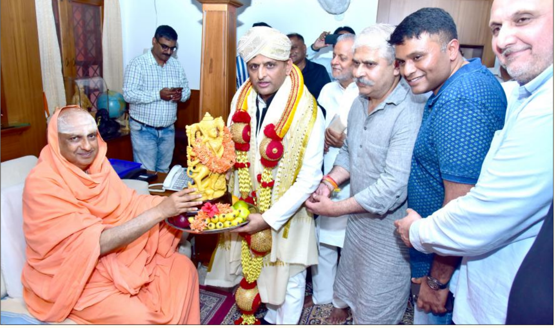
ಮೈಸೂರಿನ ಶ್ರೀ ಸುತ್ತೂರು ಮಠಕ್ಕೆ ಉತ್ತರ ಪ್ರದೇಶದ ಮಾಜಿ ಮುಖ್ಯಮಂತ್ರಿಗಳಾದ ಶ್ರೀ ಅಖಿಲೇಶ್ ಯಾದವ್‌ರವರು ಭೇಟಿ ನೀಡಿ ಪರಮಪೂಜ್ಯ ಜಗದ್ಗುರುಗಳವರ ದರ್ಶನಾರ್ಥಿವಾದ ಪಡೆದ ಸಂದರ್ಭದಲ್ಲಿ ಪೂಜ್ಯರು ಸನ್ಮಾನಿಸಿ ಆಶೀರ್ವದಿಸಿದರು. ಅವರ ವಿದ್ಯಾಭ್ಯಾಸ ಅವಧಿಯ ಎಸ್‌ಜೆ‌ಸಿಇ ಸಹಪಾಠಿಗಳು ಜೊತೆಯಲ್ಲಿದ್ದಾರೆ (19 ಜುಲೈ 2023)