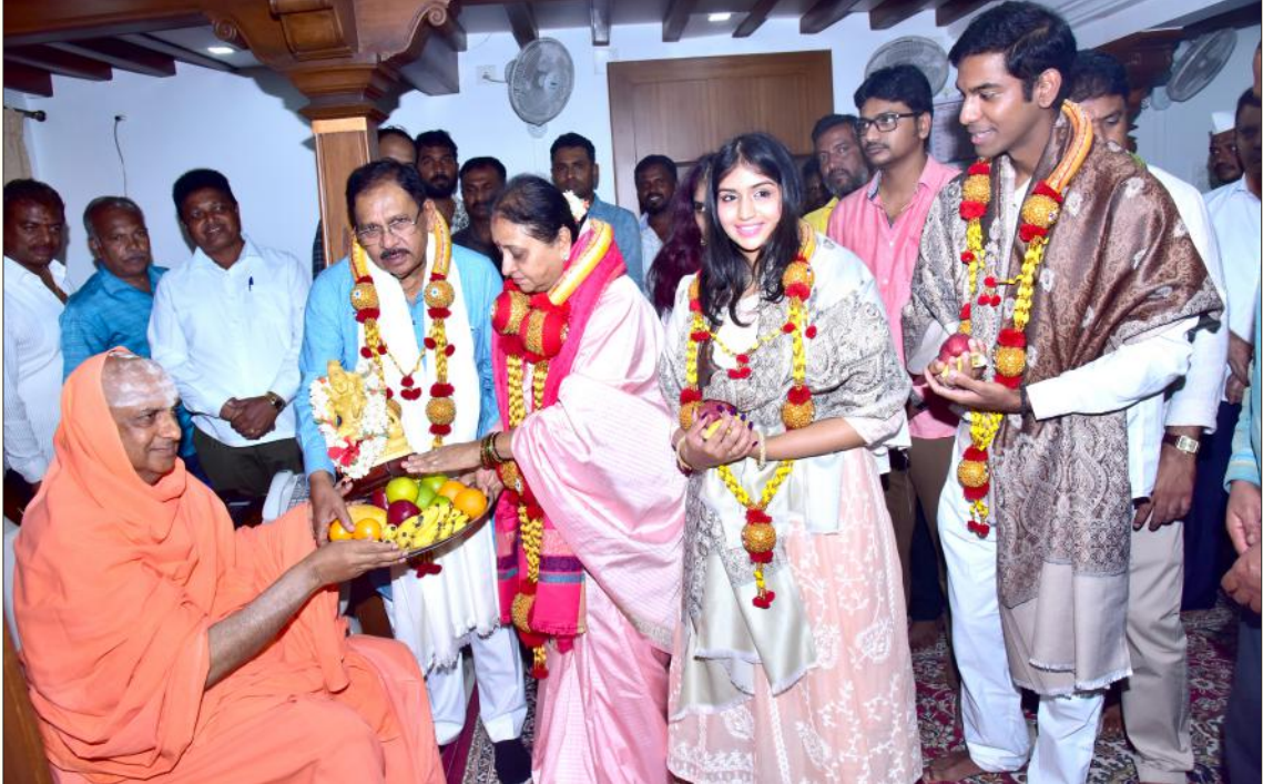
ಮೈಸೂರಿನ ಶ್ರೀ ಸುತ್ತೂರು ಮಠಕ್ಕೆ ಗೃಹ ಸಚಿವರಾದ ಶ್ರೀ ಜಿ. ಪರಮೇಶ್ವರರವರು ಕುಟುಂಬ ಸಮೇತ ಭೇಟಿ ನೀಡಿ ಪರಮಪೂಜ್ಯ ಜಗದ್ಗುರುಗಳವರ ದರ್ಶನಾರ್ಥಿವಾದ ಪಡೆದರು (1 ಜುಲೈ 2023)