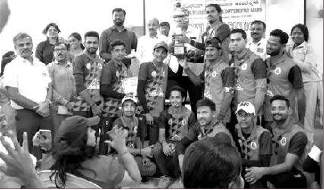
ಪ್ರಥಮ ಬಹುಮಾನ ಗಳಿಸಿದ ದಕ್ಷಿಣ ಕನ್ನಡ ಜಿಲ್ಲೆಯ ತಂಡ

ಜೆಎಸ್‌ಎಸ್ ವಿಶೇಷಚೇತನರ ಪಾಲಿಟೆಕ್ನಿಕ್‌ನ ಹಿರಿಯ ವಿದ್ಯಾರ್ಥಿಗಳ ಸಂಘವು 12ನೇ ಹಿರಿಯ ವಿದ್ಯಾರ್ಥಿಗಳ ಸಮಾವೇಶದ ಪ್ರಯುಕ್ತ ಆಂಜೋಜಿಸಿದ್ದ ಶ್ರವಣದೋಷವುಳ್ಳವರ ರಾಜ್ಯಮಟ್ಟದ ಟೆನ್ನಿಸ್‌ಬಾಲ್ ಕ್ರಿಕೆಟ್ ಪಂದ್ಯಾವಳಿಯ ವಿಜೇತ ತಂಡಗಳಿಗೆ ದಿನಾಂಕ 26.2.2023ರಂದು ನಡೆದ ಹಿರಿಯ ವಿದ್ಯಾರ್ಥಿಗಳ ಸಭೆಯಲ್ಲಿ ಬಹುಮಾನ ವಿತರಿಸಲಾಯಿತು.