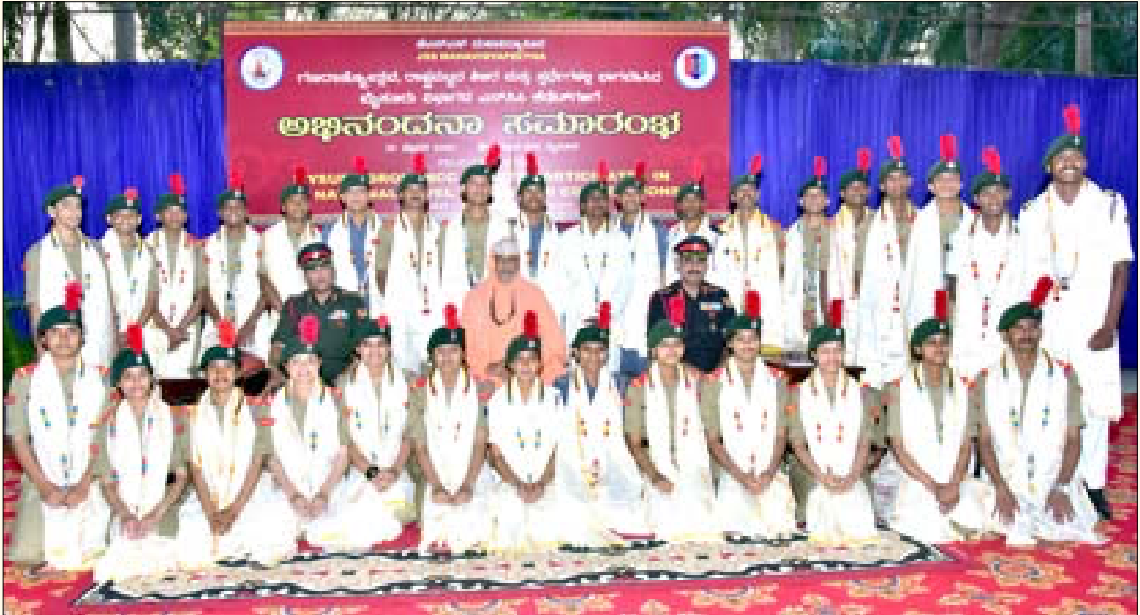
ದೆಹಲಿಯಲ್ಲಿ ನಡೆದ 74ನೇ ಗಣರಾಜ್ಯೋತ್ಸವ ಹಾಗೂ ರಾಷ್ಟ್ರಮಟ್ಟದ ವಿವಿಧ ಶಿಬಿರ ಮತ್ತು ಸ್ಪರ್ಧೆಗಳಲ್ಲಿ ಭಾಗವಹಿಸಿದ ಮೈಸೂರು ವಿಭಾಗದ ಎನ್‌ಸಿಸಿ ಕೆಡೆಟ್‌ಗಳನ್ನು ಮೈಸೂರಿನ ಶ್ರೀ ಸುತ್ತೂರು ಮಠದಲ್ಲಿ ಜಿಎಸ್‌ಎಸ್ ಮಹಾವಿದ್ಯಾಪೀಠದ ವತಿಯಿಂದ ಪರಮಪೂಜ್ಯ ಜಗದ್ಗುರುಗಳವರ ದಿವ್ಯ ಸಾನ್ನಿಧ್ಯದಲ್ಲಿ ಅಭಿನಂದಿಸಲಾಯಿತು. ಕರ್ನಾಟಕ ಶ್ರೀ ಆರ್.ಆರ್. ಮನನ್ ಮತ್ತು ಕರ್ನಾಟಕ ಶ್ರೀ ಮನೀಷ್ ಪ್ರಸಾದ್‌ರವರುಗಳಿದ್ದಾರೆ (20 ಫೆಬ್ರವರಿ 2023)