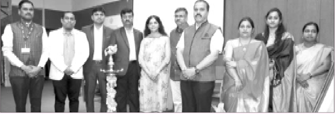
Lamp Lighting by the dignitaries for Global Alumni Meet 2k23.

JSS Academy of Technical Education, Bengaluru organised Global Alumni Meet-2k23 on 28.2.2023 at its campus as part of its Silver Jubilee Celebrations.