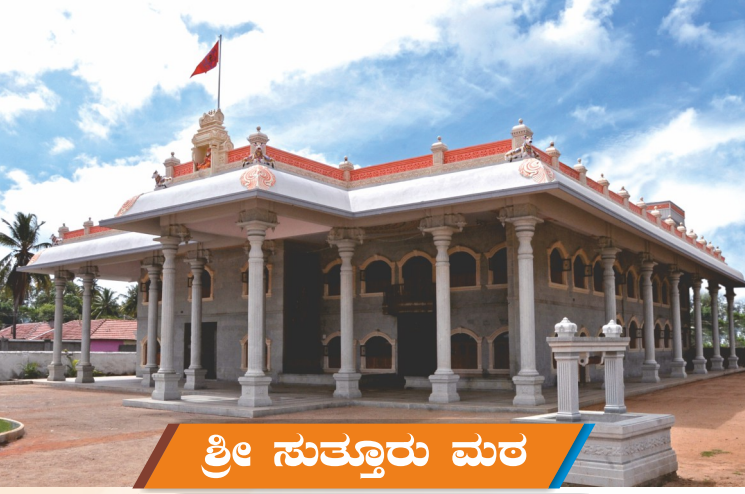
ಶ್ರೀ ಸುತ್ತೂರು ಮಠ

ಸುತ್ತೂರು ಶ್ರೀಮಠ ಎಂದೇ ಪ್ರಸಿದ್ಧವಾಗಿರುವ ಜಗದ್ಗುರು ಶ್ರೀ ವೀರಸಿಂಹಾಸನ ಮಹಾಸಂಸ್ಥಾನ ಮಠವು ಸಾವಿರ ವರ್ಷಗಳಿಗೂ ಹಿಂದೆ ಆದಿಜಗದ್ಗುರು ಶ್ರೀ ಶಿವರಾತ್ರೀಶ್ವರ ಶಿವಯೋಗಿಗಳಿಂದ ಸ್ಥಾಪಿತವಾಯಿತು. ಅಂದಿನಿಂದಲೂ ನಿರಂತರವಾಗಿ ಧಾರ್ಮಿಕ, ಆಧ್ಯಾತ್ಮಿಕ, ಸಾಮಾಜಿಕ, ಶೈಕ್ಷಣಿಕ ಹಾಗೂ ಸಾಂಸ್ಕೃತಿಕ ಸೇವಾ ಕೈಂಕರ್ಯವನ್ನು ನಡೆಸುತ್ತಾ ಬಂದಿದೆ. ಶ್ರೀಮಠವು ತನ್ನ ಚಟುವಟಿಕೆಗಳನ್ನು ರಾಜ್ಯದ ಕೆಲವು ಜಿಲ್ಲೆಗಳು, ಇತರ ರಾಜ್ಯಗಳು ಹಾಗೂ ವಿದೇಶಗಳಿಗೂ ವಿಸ್ತರಿಸಿದೆ. ಸುತ್ತೂರು ಶ್ರೀಕ್ಷೇತ್ರ ಹಾಗೂ ಶಾಖಾಮಠಗಳಲ್ಲಿ ಭಕ್ತಾದಿಗಳು ಹಾಗೂ ಸಾರ್ವಜನಿಕರ ಅನುಕೂಲಕ್ಕಾಗಿ ಸಭಾಭವನಗಳು, ಮಂಗಳ ಮಂಟಪಗಳು ಹಾಗೂ ಅತಿಥಿಗೃಹಗಳಿವೆ.